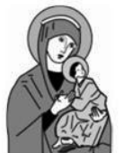
OLV van Altijdurende Bijstand