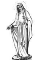
O.L.V. van Lourdes