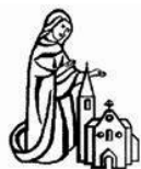
O.L.V. Onbevlekt Ontvangen